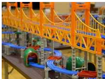
トトレインは、走らせる車両を全国の新幹線のものにすることも可能