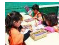
その場で参加できる コーナーなども検討